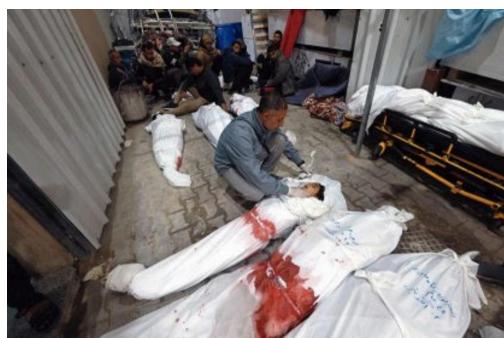
Figura 4 — Mortos na Faixa de Gaza

O trecho da matéria “Talvez o jornalismo nativo considere essa cena como um exercício do direito à autodefesa de Israel” fazendo uma referência a uma foto feita por Mohammed Abed que evidencia a situação de calamidade e terror vivida pelos palestinos na faixa de Gaza estabelece uma crítica direta ao jornalismo brasileiro em relação a desumanização frente a morte de milhares de palestinos, ainda mais comparado com a forma empática com a qual vem cobrindo as mortes de israelenses.