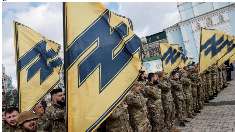
Figura 1: Membros do Batalhão Azov com símbolos da SS nazista

O Batalhão Azov foi formado em maio de 2014 no contexto do pós-Euromaidan e em meio ao início da guerra civil no leste da Ucrânia (Cavandoli, 2016). O grupo ganhou notoriedade por ser formado por voluntários e foi integrado à Guarda Nacional da Ucrânia como parte do movimento de infiltração da extrema direita no governo ucraniano. O grupo é amplamente reconhecido por suas ligações com ideologias de extrema-direita e nacionalismo radical. Apesar disso, o governo ucraniano defende que a unidade é composta por combatentes patriotas empenhados na defesa do país contra a agressão externa. Com o início da invasão russa em fevereiro de 2022, o Batalhão Azov voltou a estar na linha de frente dos combates, tornando-se um símbolo da luta ucraniana contra as forças russas.